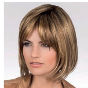
Modell Coco Mono