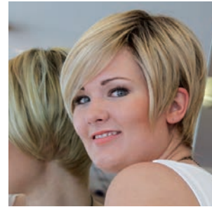
Modell Star Fascination